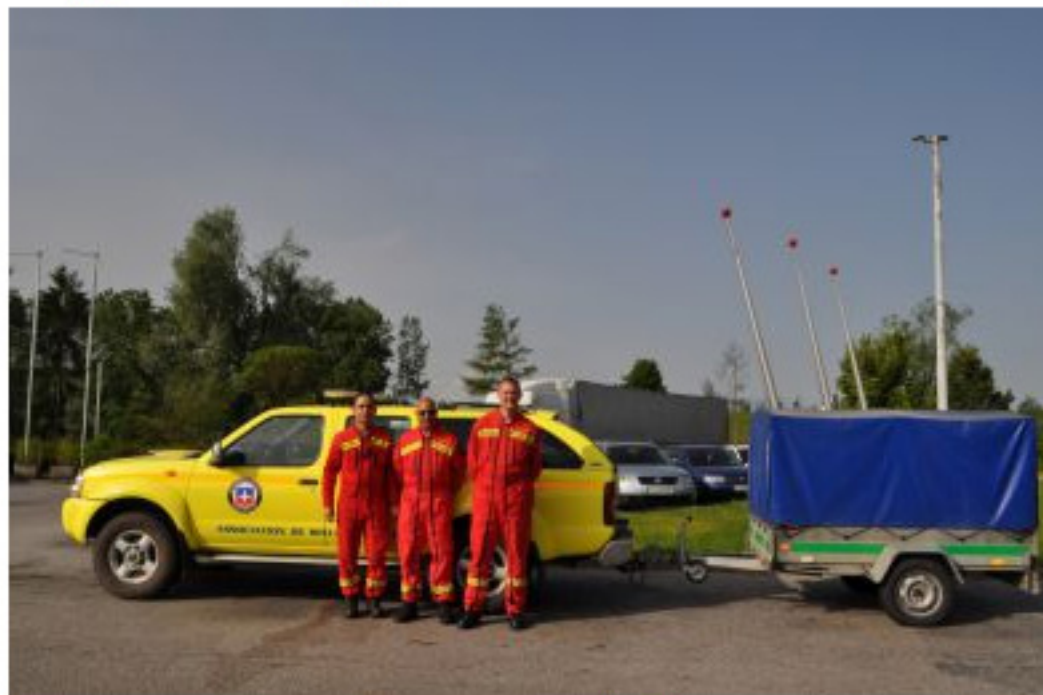
Photo prise le 23/05/2014 sur la route en Slovénie à 300 km du lieu de notre Mission